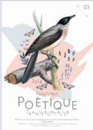
Printemps Poétique Transfrontalier