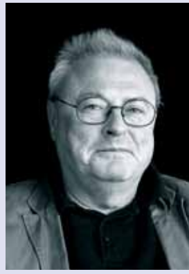
Jörg W. Gronius