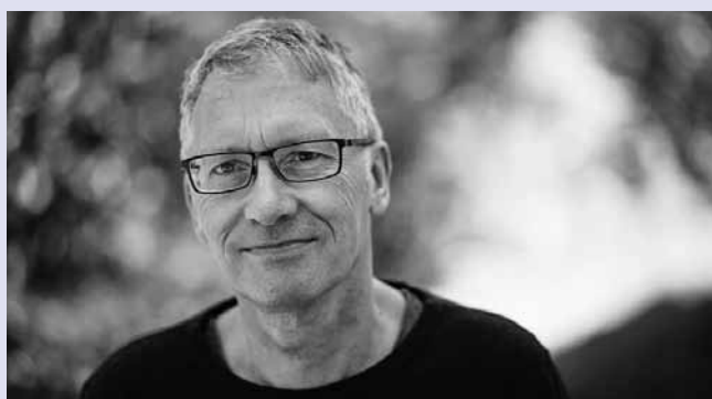
Erhard Schmied