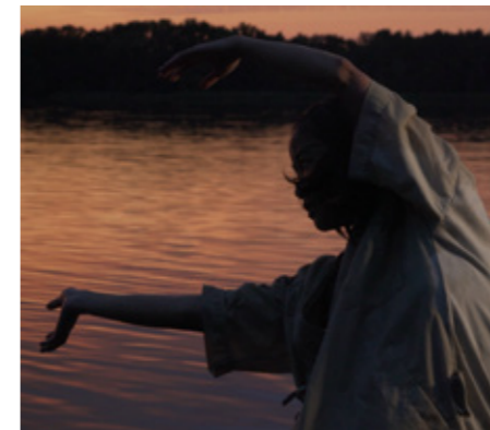
Abb.