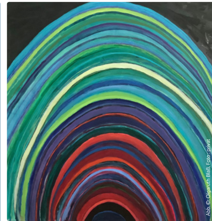
Abb. ©: Olgaruth Blab, Foto: privat