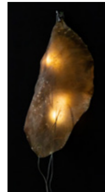
Abb. © Sayaka Katsumoto / VG Bild-Kunst, Bonn, 2026

Video, Multimedia-Installation Studio & Studioblau