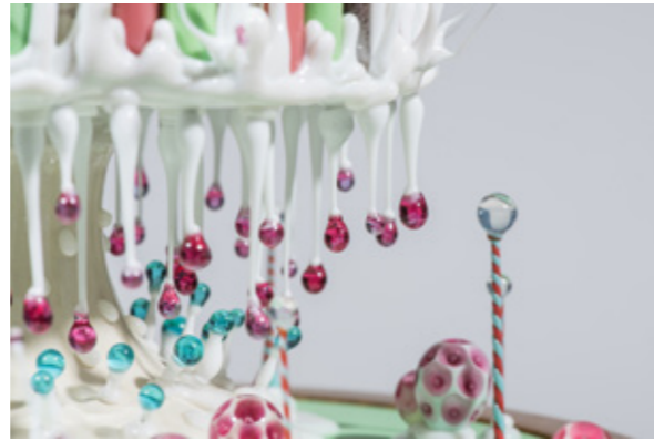
Abb. ©: Steffen Lang, Foto: © Johannes-Maria Schlorke

Die Ausstellung vereint drei künstlerische Positionen, die sich auf unterschiedliche Weise mit Zerbrechlichkeit, Spur und feiner Materialität auseinandersetzen. Glas, Faden und Nadel werden zu zentralen Mitteln, um fragile Welten sichtbar zu machen – leise, präzise und aufmerksam.