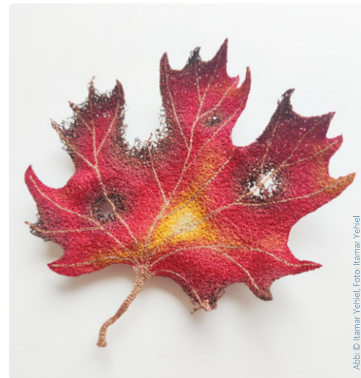
Abb.: © Itamar Yehiel, Foto: Itamar Yehiel